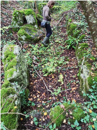
Pinterville , allée sépulcrale au fond du vallon du parc, 1947