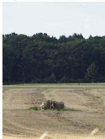
Les Ventes , dolmen de l'Hôtel-Dieu, 1910