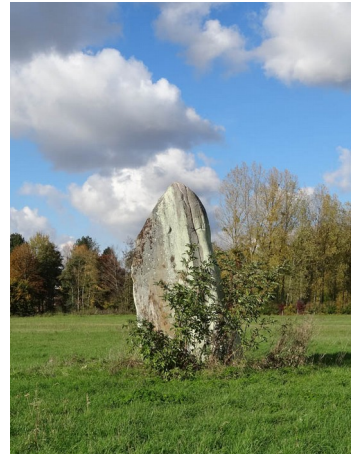
Neaufles Auvergnay , menhir dit « Pierre de Gargantua », 1934