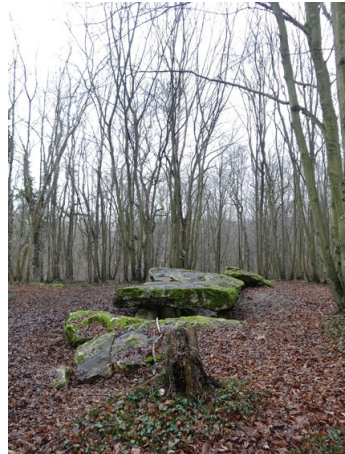
Dampmesnil (Vexin sur Epte) Allée couverte, 1907