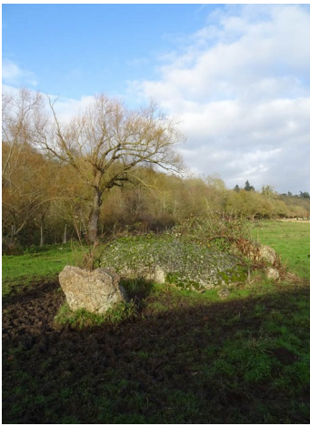
Acon , nécropole dolménique des « Prés d'Acon », 1998