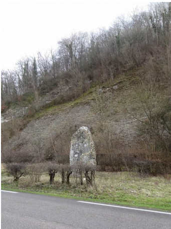
Val de Reuil , menhir d'Incarville au bord du chemin n°11, 1927