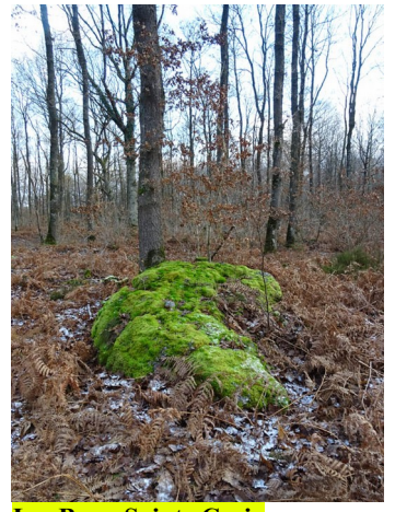
Les Baux Sainte Croix , alignement de trois menhirs, 1975