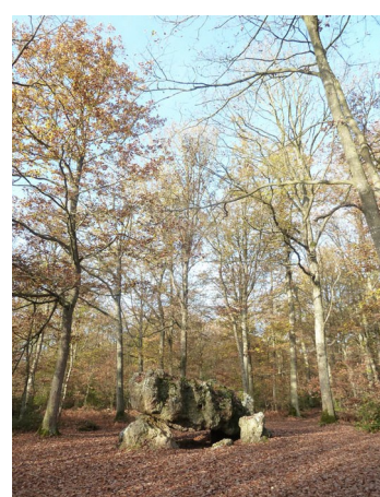
Les Ventes , dolmen dit « La Pierre Courcoulée », Liste 1887