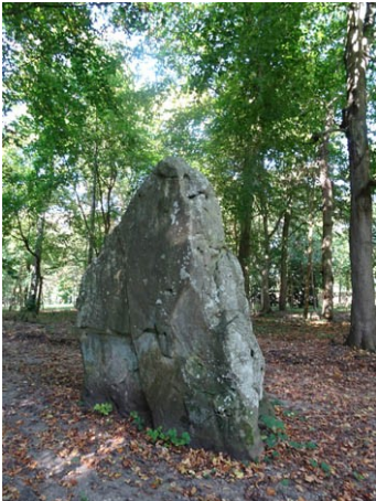
Breuilpont , menhir « La Pierre Frite », Château de Loray, 1950