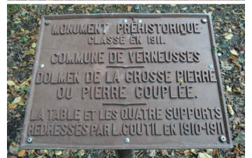
Verneusses , dolmen dit «La Grosse Pierre » au lieudit le village, 1911