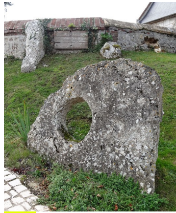
Aizier , sépulture mégalithique : dalle percée et vestiges pouvant subsister de l'allée couverte en l'état et in-situ, 1999