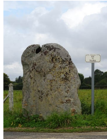
Landépereuse (Mesnil en Ouche) , menhir de la Longue Pierre, 1911