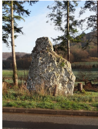
Port-Mort , menhir dit « gravier de Gargantua », 1923