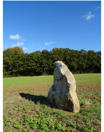
Serquigny , menhir du Croc, lieudit « Plaine de Loquerai », 1991