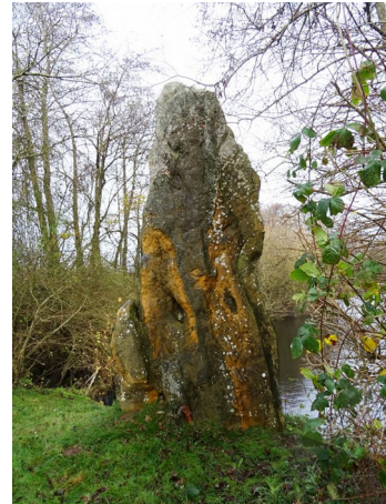
Saint Ouen d'Attez , menhir dit « Pierre de la Joure », 1934